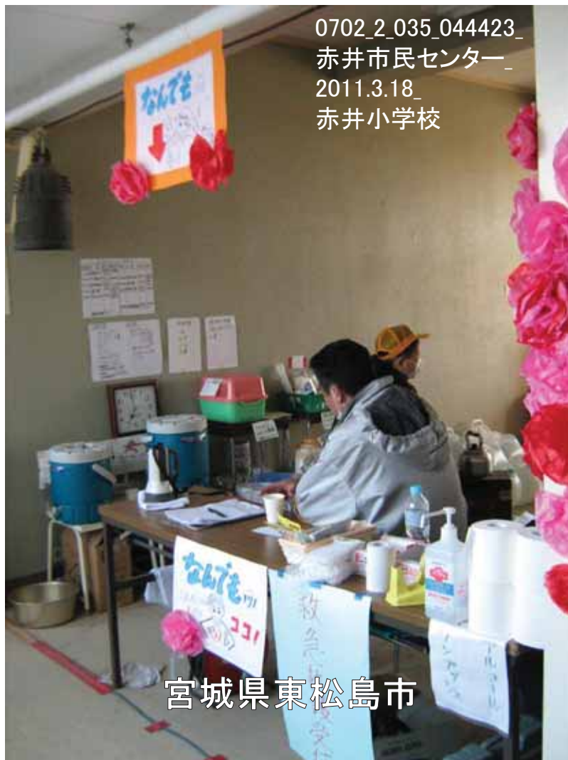
0702_2_035_044423_ 赤井市民センター 2011.3.18_ 赤井小学校